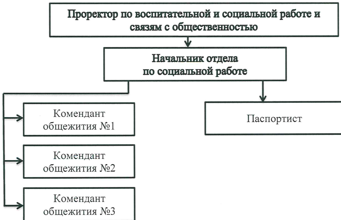
Схема организационной структуры отдела по социальной работе